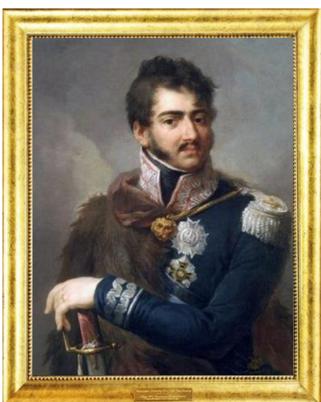
Książę Józef Poniatowski z Krzyżem Wielkim Virtuti Militari jako wódz naczelny wojsk Księstwa Warszawskiego

Order Wojenny Virtuti Militari – najwyższe polskie odznaczenie wojenne, nadawane za wybitne zasługi bojowe. Jest jednym z najstarszych orderów wojennych na świecie. Ustanowiony przez króla Stanisława Augusta Poniatowskiego 22 czerwca 1792 r. dla uczczenia zwycięstwa w bitwie pod Zieleńcami Dewiza orderu brzmi: Honor i Ojczyzna. Pierwszą udekorowaną osobą był książę Józef Poniatowski