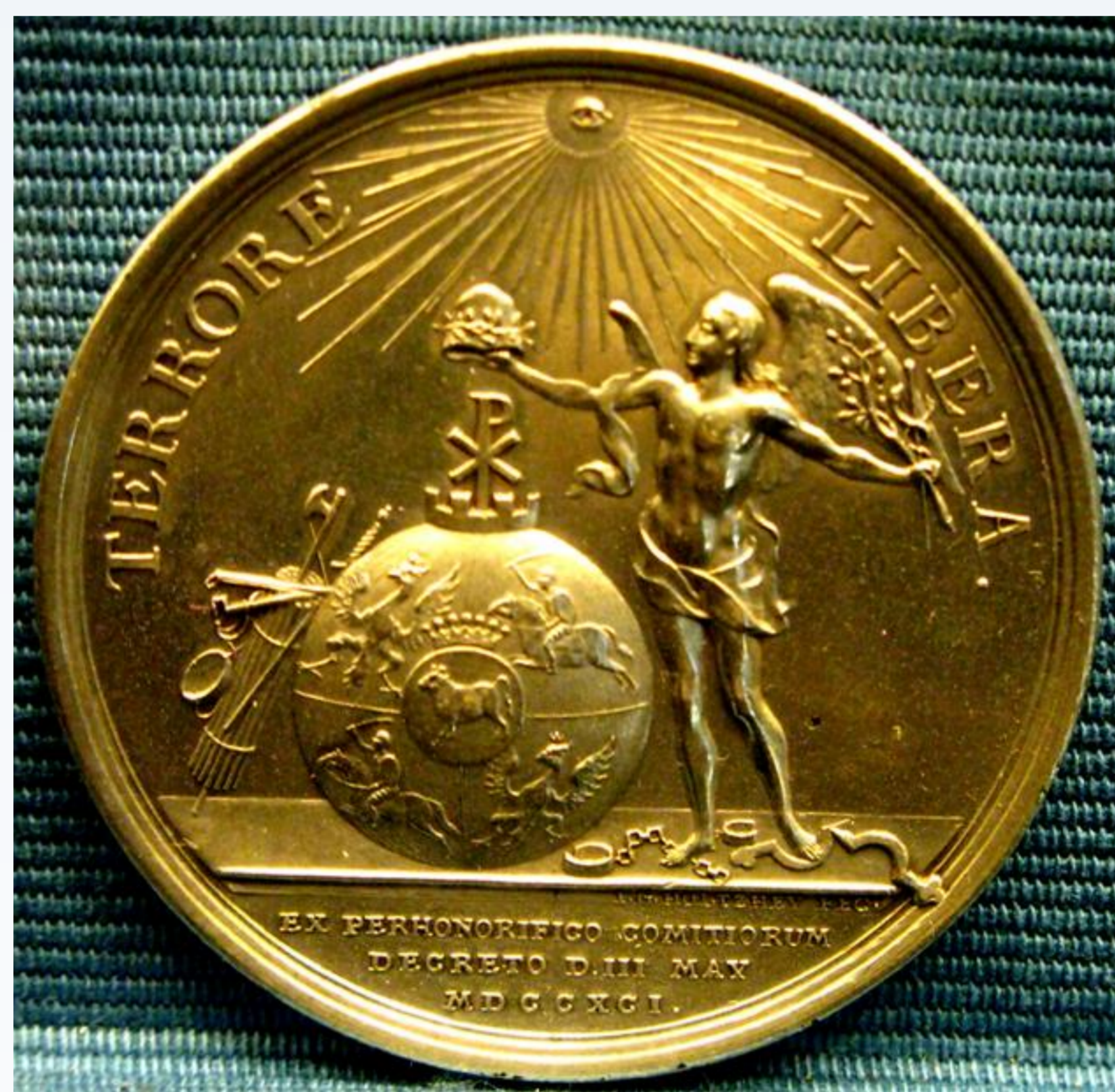
Medal wybitny w 1791 roku z okazji uchwalenia Konstytucji 3 maja