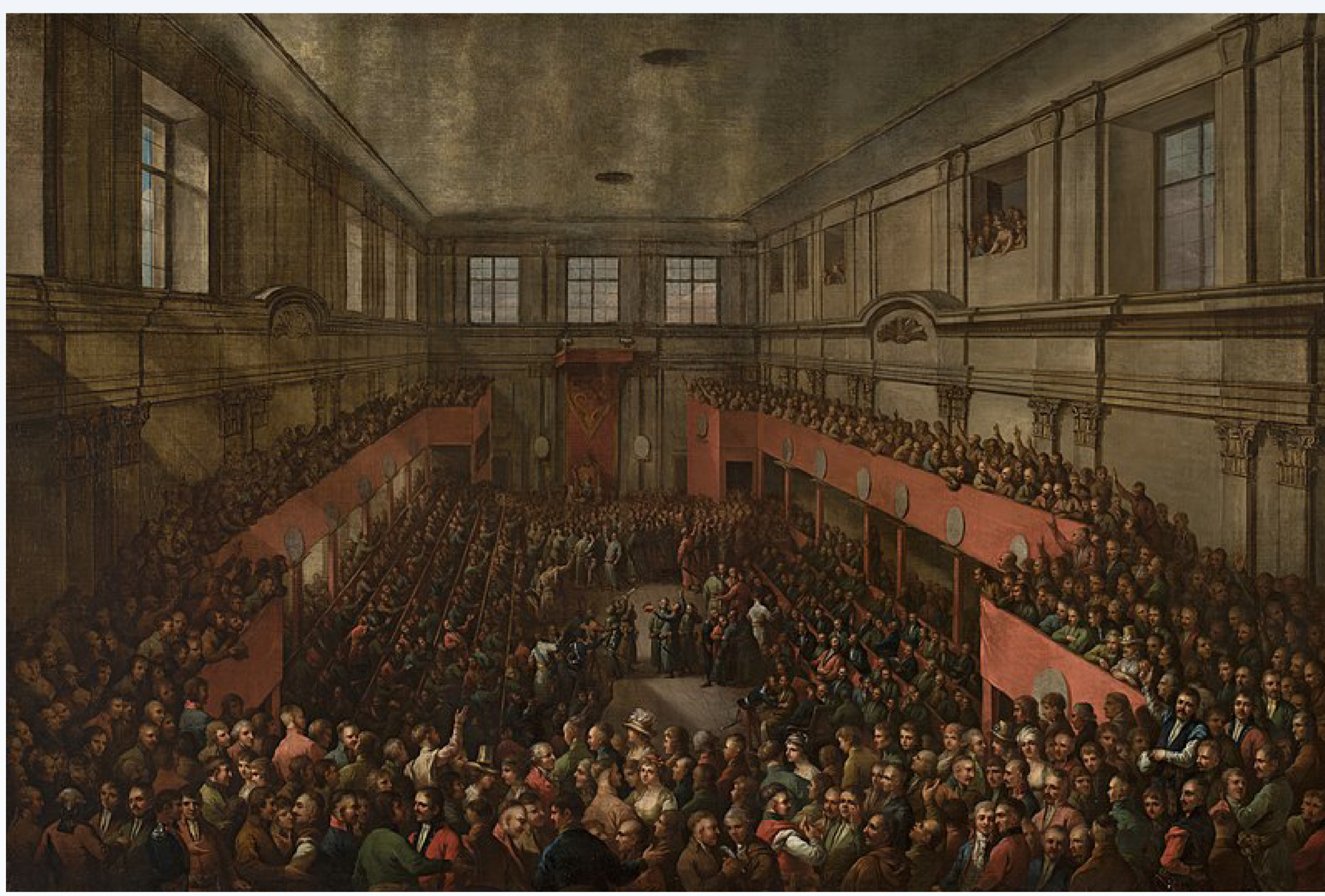
Uchwalenie Konstytucji 3 maja 1791 roku, obraz Kazimierza Wojniakowskiego z 1806 roku

Kazimierz Nestor Sapieha, książę, generał artylerii litewskiej w latach 1773–1793, marszałek konfederacji Wielkiego Księstwa Litewskiego w czasie Sejmu Czteroletniego w 1788 roku, jeden z twórców Konstytucji 3 maja, był jednym z jej sygnatariuszy. Przez ciotkę biskupa Ignacego, Annę, spokrewniony z biskupem warmińskim. Po tych dopiskach zrozumiesz dlaczego popierał reformy Sejmu Wielkiego. Ale jego krewni byli też po drugiej stronie – Szczęśny Potocki czy Seweryn Rzewuski.