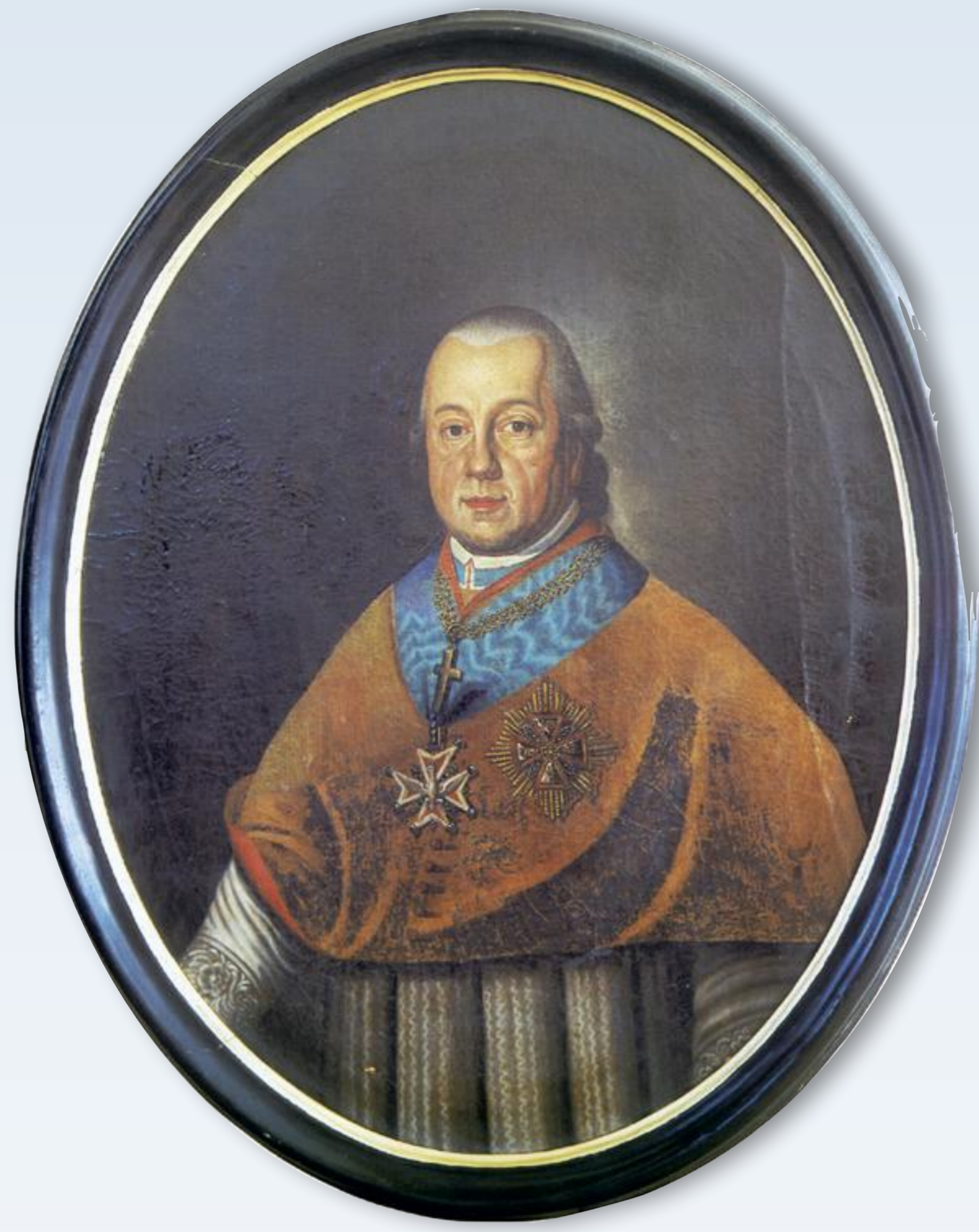
Biskup warmiński Ignacy Krasicki, obraz nieznanego malarza z ok. 1790 w zbiorach WSD „Hosianum”