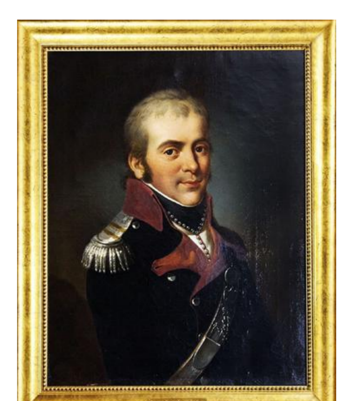
Kazimierz Franciszek Krasicki (1774–1844), bratanek biskupa Ignacego Krasickiego – uczestnik powstania kościuszkowskiego, uczestnik wojen napoleońskich, odznaczony medalem Virtuti Militari za wojnę polsko-rosyjską 1792 r.