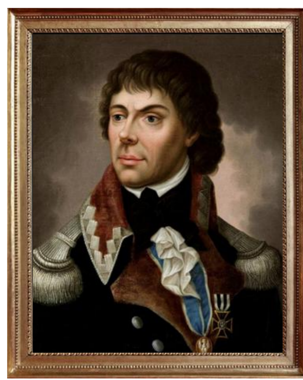
Tadeusz Kościuszko jako generał lejtnant wojsk koronnych w czasie wojny 1792 roku, druga osoba uhonorowana Virtuti Militari.