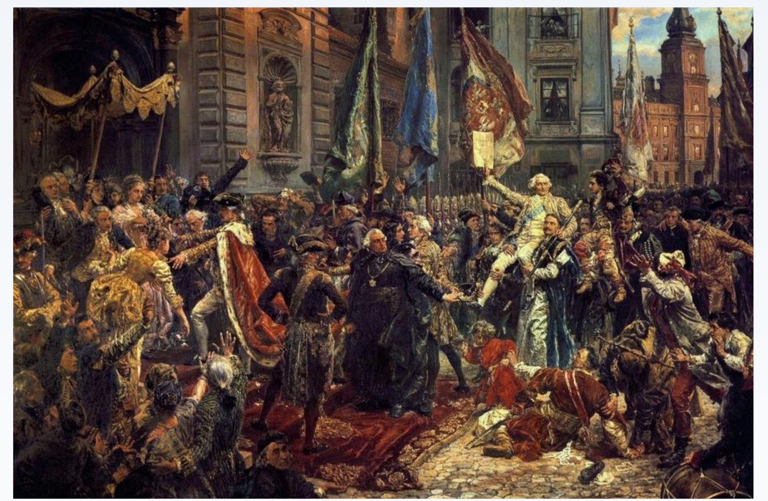
Konstytucja 3 Maja 1791 roku, obraz Jana Matejki 1891

Po uchwaleniu Ustawy Rządowej 3 Maja 1791 roku wiersz przesłany do Warszawy: