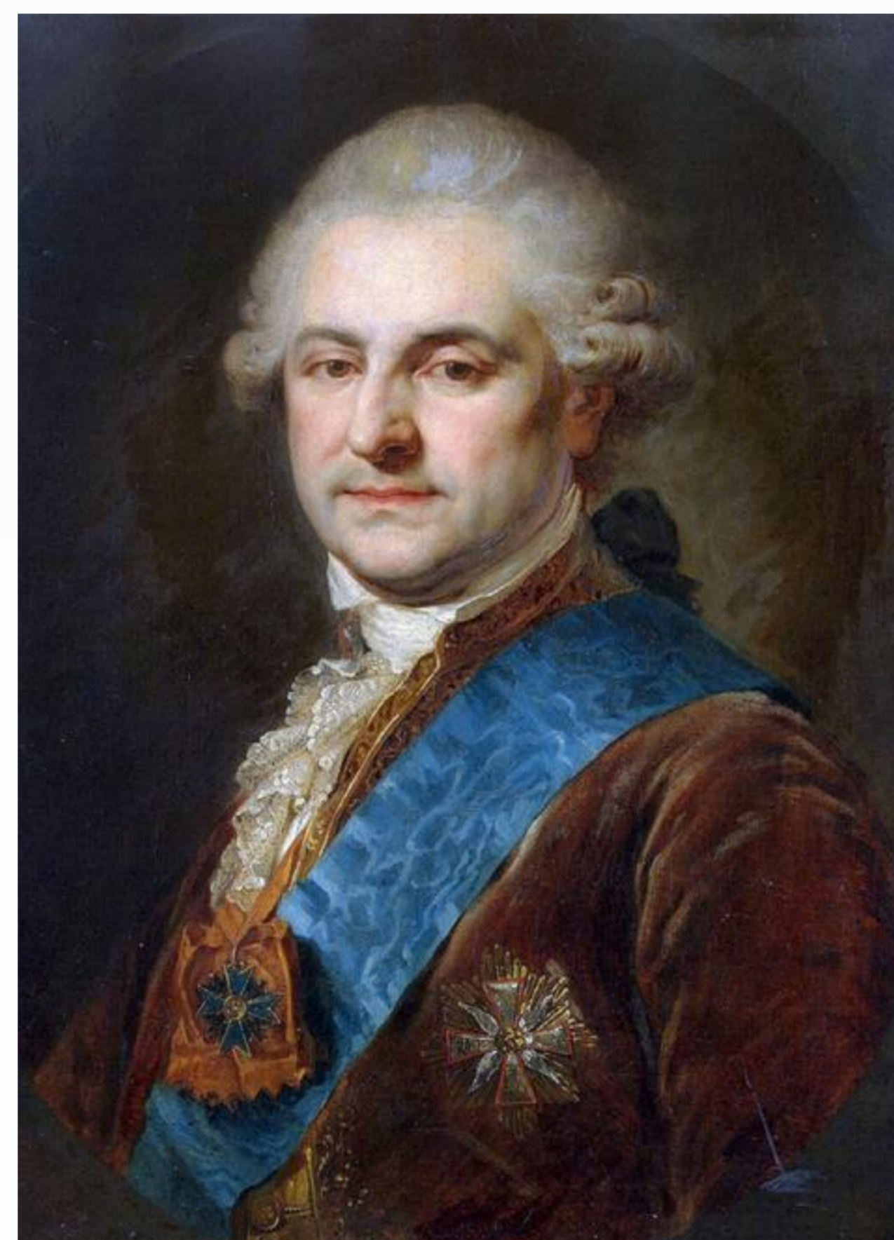
Król Stanisław August Poniatowski, jeden z autorów Konstytucji 3 maja. Portret pędzla Johana Baptysty Lampiego

Zniósł moment, co wiek skazał, a jarzmu niezdolny, Wspaniały, z ugnębienia powstał naród wolny, By okazał całemu światu w swej robocie, Co może dzielna rozpacz, gdy wsparta na nocie